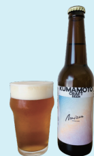
熊本クラフトビール